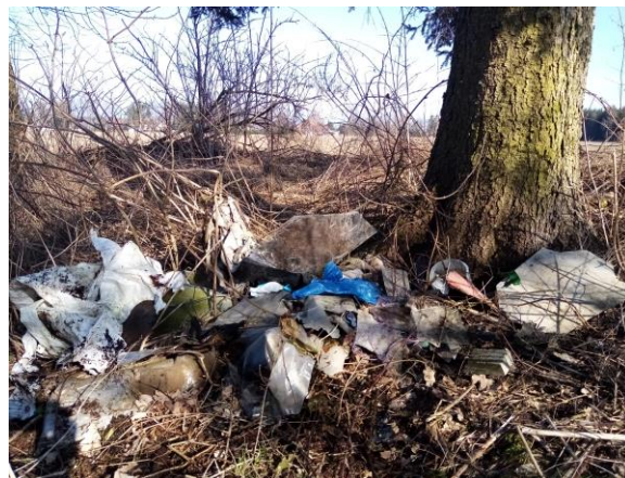
Fotografie z místa sběru bioodpadu

Často slyšíme výtky na nepořádek vyskytující se všude možně po obci, ale uvědomme si, že za to nemohou naši zaměstnanci, ale naši občané a projíždějící. Dost často nám nechávají všude povalovat eternit, staré pneumatiky, nehledě na sběrné místo bioodpadu, tam se neustále vyskytuje železo, sklo, zaházený všelijaký nepořádek, který tam nepatří. Pokud se mi všichni nezačneme k naší obci chovat s respektem, nepořádek nikdy nezmizí. Není výjimkou, že nám před obecním úřadem naši občané vyhodí směsný komunální odpad jen tak před popelnice. My tento odpad uklidíme, a často to netrvá ani týden a můžeme tento odpad uklízet znovu. To samé je teď na Ostrém Kameni u kontejnerů, kde obec vybudovala „hnízdo“ pro umístění kontejnerů a jak to dopadlo? Z tohoto místa se stalo semeniště všelijakého odpadu, často jsou i před kontejnery umístěny pytle se směsným odpadem, který tam nepatří.