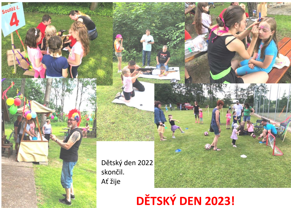
Dětský den 2022 skončil. Ať žije

Řadu dalších fotek si můžete prohlédnout na Facebooku obce Javorník.