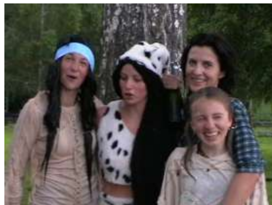
Legrace si užili všichni dost...