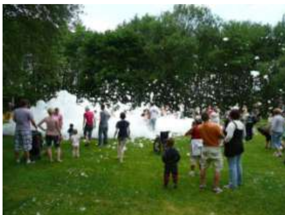
Pěna to ale stejně u dětí vyhrála