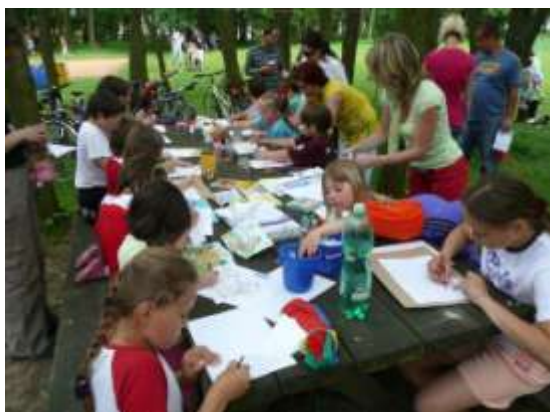
O malování byl velký zájem