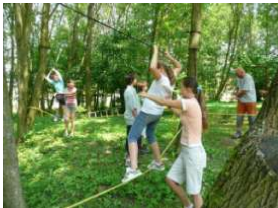
Na lanech to chce zručnost