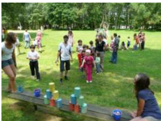
Ani na tradiční soutěže se nezapomnělo