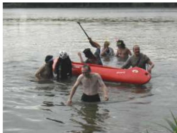
Na akci se objevili i nejnovější obyvatelé obce. Buďte vítáni!

Mnoha lidem neznámý „skalní golf“, který překvapuje i zkušené golfisty, tentokrát zaskočil svojí připravenou (nebo nepřípravenou?) trasou všechny přítomné. Snad nikdo nečekal, že se ocitnou až ve svitavském rybníku Rosnička.