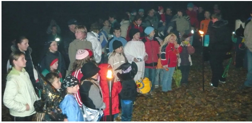
I při nepříznivém počasí byla účast veliká...