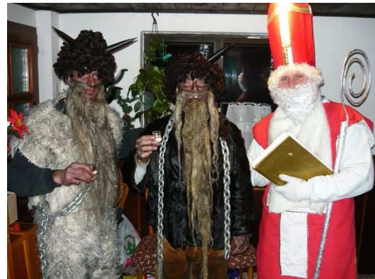
A z některých čertů šel skutečně strach...