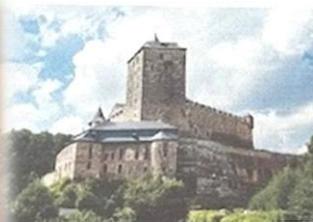
Příloha č. 1