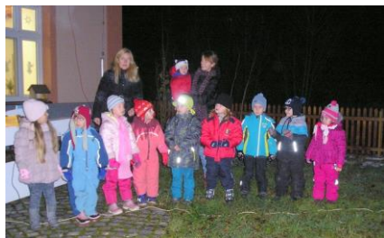
Rozsvěcení vánočního stromečku

V pátek 27. 11. uspořádala karelská mateřská škola ve spolupráci s kulturní komisí obce vánoční rozsvěcení stromečku. Společně jsme si zazpívali vánoční koledy za doprovodu klavíru, na odbyt na prodejním stánku šly adventní dekorace vyrobené našimi dětmi ve školce. Samotným vyvrcholením bylo rozsvícení stromečku, který se nakonec přes drobné zaváhání přeci jen rozzářil celý. Moc děkujeme všem, kteří dorazili slavnostně zahájit adventní období – a že Vás bylo! Rozsvěcení vánočního stromečku bylo krásnou akcí, protknutou přátelskou atmosférou, radostí ze společného setkání, zimní koledovou náladou a vůní punče a teplého čaje.