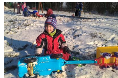
Zimní hry na sněhu

Koncem roku 2015 jsme se společně s rodiči rozloučili Vánoční besídkou. Děti zazpívaly, přednesly naučené básničky a společně zahrály pohádku Zajícova chaloupka. Po besídce nás navštívil Ježíšek, který dětem nadělil spoustu nových hraček a didaktických her. Na závěr jsme společně s rodiči i dětmi poseděli u cukroví, čaje a kávy.